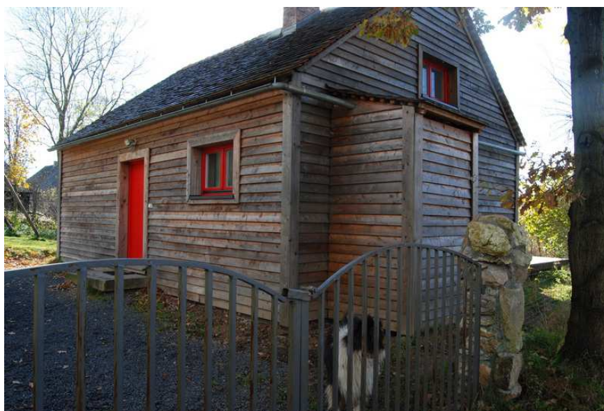
Dom ze słomy