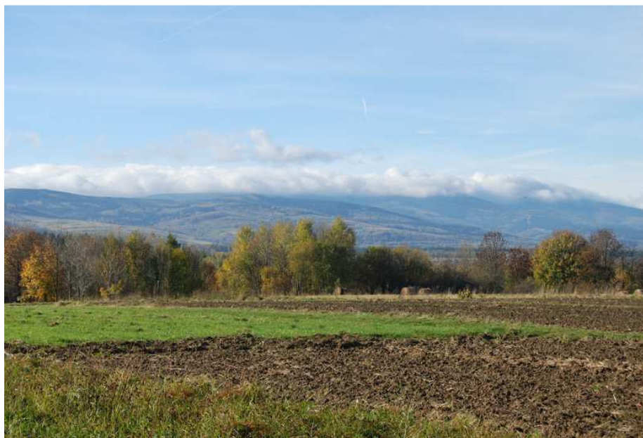
Widok z Gajówki